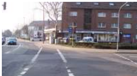
Fuß- und Radweg an der Einmündung der Humboldtstraße in die Kaiserstraße...