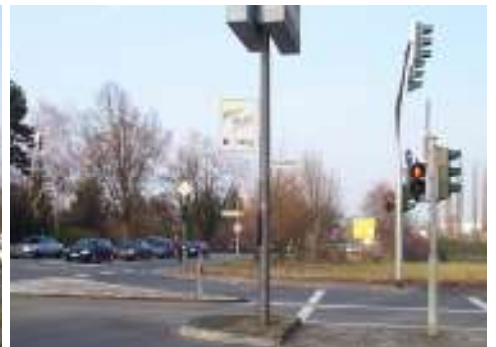
Einmündung Humboldtstr.: Hier endet der Radweg entlang der Steinstraße wieder. Die weitere Radverkehrsführung ist absolut unklar.