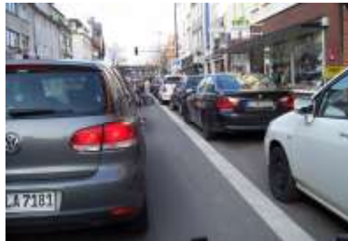
Die Verhältnisse auf der Hauptstraße sind beengt, Radfahren wird subjektiv als gefährlich empfunden.

Natürlich gibt es parallel dazu die touristisch schöne Route entlang des Rheins, die aber als Alltagsverbindung nicht taugt bzw. bei Hochwasser oder bei Dunkelheit unpassierbar ist.