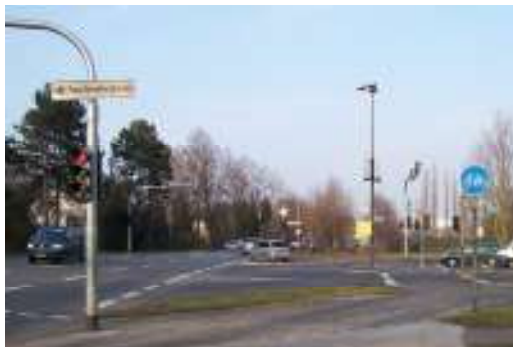
Einmündung Theodor-Heuss-Straße: Hier beginnt der Radweg entlang eines Teilstücks der Steinstraße

Die Auffahrtsmöglichkeit von der Straße auf den Radweg ist von weitem nicht zu erkennen.