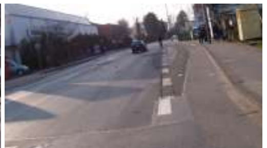
...der nach wenigen hundert Metern an dieser Bushaltestelle endet und die Radfahrer zwingt, sich wieder in den reichlich fließenden Verkehr einzufügen!