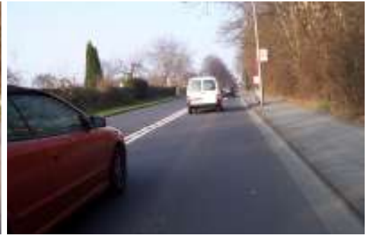
Das Einhalten des Sicherheitsabstandes durch überholende Pkw ist auf der Steinstraße oft nicht gewährleistet.