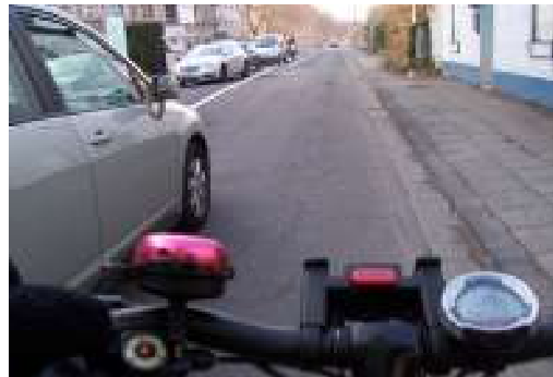
Beim Überholen wird oft der Sicherheitsabstand nicht eingehalten (Hauptstr., Fahrtrichtung Ensen)