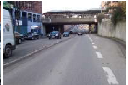
Die Strecke unter der Unterführung verleitet zum Schnellfahren. Radfahrer werden durch abbiegende Autos in Bedrängnis gebracht.