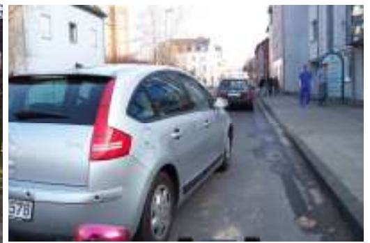
Nach dem Einfädeln vom straßenbegleitenden Radweg entlang der Kölner Straße/Hauptstraße aus Richtung Ensen wird der Radverkehr regelrecht ausgebremsst