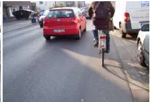
Unterwegs auf der Kaiserstraße in Urbach mit Fahrtrichtung Porz: Eng und gefährlich